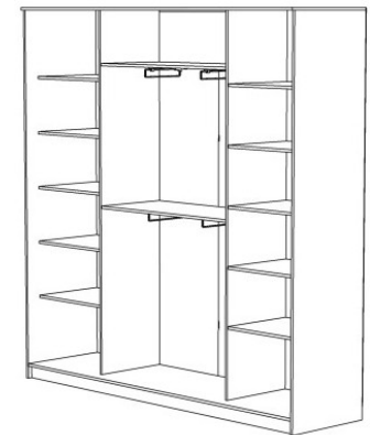
Изделие в сборе